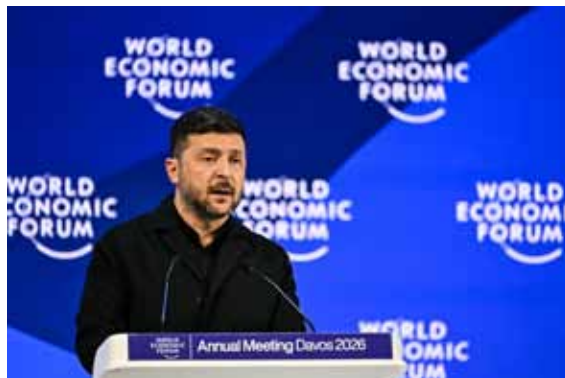
1月23日、スイスで開かれていた世界経済フォーラム(WEF)年次総会(ダボス会議)で演説するウクライナのゼレンスキー大統領

た幅広いテーマを話し合います。ロシアとの戦争が続くウクライナのゼレンスキー大統領も会議で演説し、停戦が実現しないのは、ヨーロッパがアメリカの動きを気にするばかりで、主体性に欠けているからだとして批判しました。