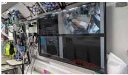
【画像転送装置】 診療の状況や心電図モニター、エコー画像、GPSによる位置情報を、病院とリアルタイムで共有でき、収容後の治療につなげていきます。

できるよう、特別に設計されたバス型の「高規格救急車タイプ」です。 ★医師、看護師、救急救命士によるチームで運用しています。